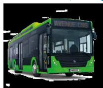
Temsa tilbyr 12m bybuss