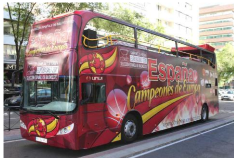
Unvi - Spania