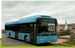
TEDOM fra Tsjekia har gassbusser i lavgulv og lavrente utførelse – Tedom motor.