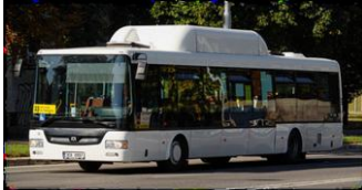
SOR fra Tsjekia har gassbusser i lavgulv og lavrente utførelse – Iveco motor.