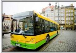
Solbus fra Polen på LNG