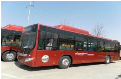
Yutong har levert over 1.500 busser av denne type til Venezuela i 2011